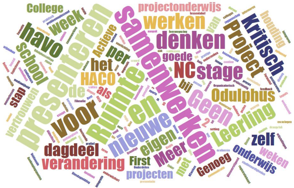
Figuur 2. Wordcloud naar aanleiding van tabellen dataverzameling enquête PLG-leden.

Odulphus niet zitten, hij wilt hooguit een dagdeel vrij maken, terwijl respondent 6 vindt dat het misschien nodig is om oude vertrouwde werkwijzen los te laten en risico te nemen. Respondent 12 voegt hier min of meer aan toe dat het risico nemen wellicht inhoudt dat er gesneden moet worden in de lessentabel. De vraag is hoe heilig de huidige lessentabel voor ons is en in hoeverre we bereid zijn hier op de wat langere termijn in te gaan snijden of op een flexibelere manier mee om te gaan (binnen de grenzen van wat de overheid ons voorschrijft). Hier ligt o.i. een uitdaging.